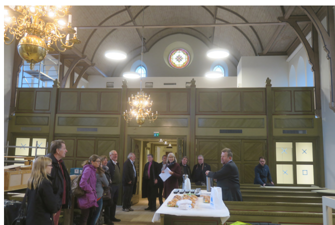
Foto från bygget av ny församlingsdel i väst delen av Södra Kedums 1920-talskyrka.