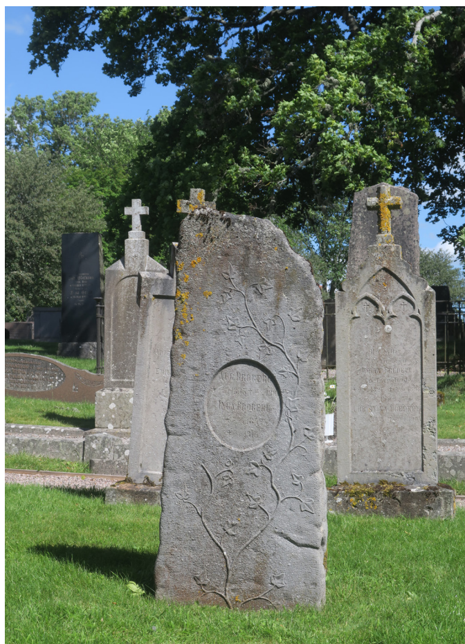
Blivande kulturgravar på Lugnås kyrkogård.