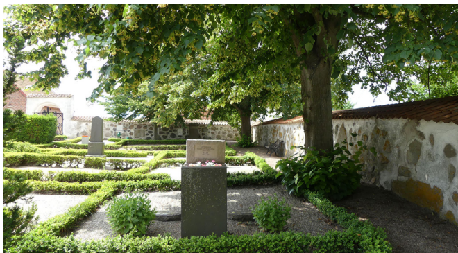
Skånsk kyrkogård.

Årsmötet tog beslut om att införa en medlemsavgift som för år 2021 sattes till 200 kr.