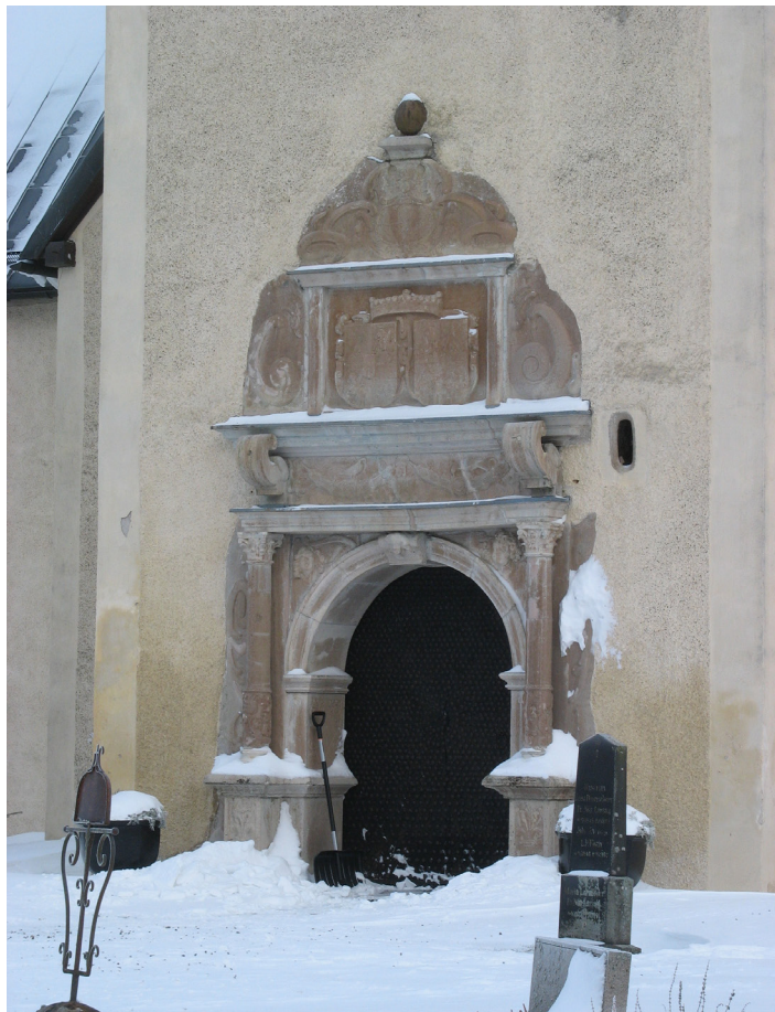
Brahekyrkan på Visingsö i vinterskrud.

Akilleshälen är bristen på ekonomiska resurser, Vi söker nu etableringsstöd från Riksantikvarieämbetet. Men det